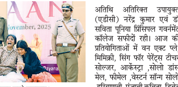
क्षेत्रीय युवा महोत्सव में मंच पर अभिनय प्रस्तुत करते कलाकार।