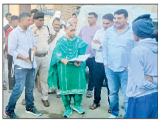
हरिभूमि न्यूज रोहतक

दोनों आरोपी गांव बलियाणा के ही रहने वाले बताए जा रहे। ये दोनों वारदात के बाद फरार हो गए थे और हरियाणा छोड़ने की फिराक में थे। लेकिन सीआईए सोनीपत और रोहतक पुलिस की संयुक्त कार्रवाई में दो आरोपियों को खरखोदा परिया में मुठभेड़ के बाद गिरफ्तार कर लिया गया।