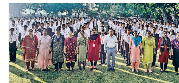
रोहतक। सैनी स्कूल में वंदे मातरम गाते शिक्षक व छात्र।