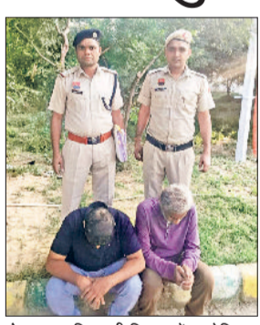
रोहतक। पुलिस की गिरफ्त में आरोपित।