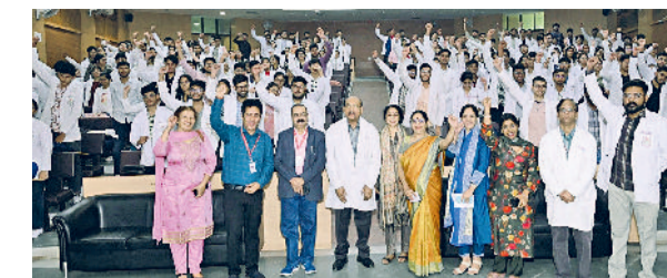
रोहतक पीजीआई में वंदे मातरम का उद्घोष करते अधिकारी व छात्र।