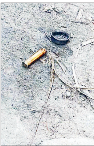
मौके पर पड़ा खोल।